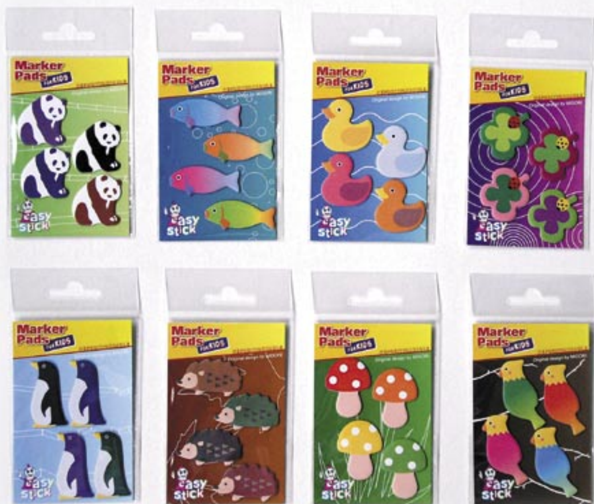
Figure adesive riposizionabili in 8 diversi soggetti per ragazzi. Confezione da 40 pezzi per soggetto.